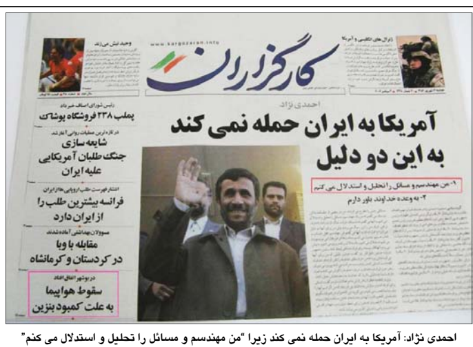
احمدی نژاد: آمریکا به ایران حمله نمی‌کند زیرا «من مهندس و مسائل را تحلیل و استدلال می‌کنم»

ما تاکنون هر دو طرف را به ادامه گفتگوهای متقابل، پذیرش قطعنامه‌های سازمان ملل و حل مناقشه اتمی از طریق آژانس بین‌المللی تاکید کرده‌ایم. اما اکنون بحران فراتر رفته و بخصوص در دو سال و نیم گذشته همواره سیاست خارجی جمهوری اسلامی تنش‌زاتر شده است. از جمله از طریق اظهارات و اقدامات شخص احمدی نژاد در مورد اسرائیل و هولوکاست، اعتماد عمومی به سیاستمداران ایران را به پائین‌ترین حد خود رسانده و روابط دیپلماتیک با دولت ایران را در سطح بین‌المللی به طور فاحشی تنزل داده است. این امر بازتاب خود را در برخورد به توافق اخیر آژانس با ایران بیش از پیش نشان داد. از یک سو، دولت ایران با آژانس در برخی زمینه‌های مورد مناقشه در برنامه اتمی‌اش به توافق رسیده است، از سوی دیگر بدون توجه به این توافق، بحث بر سر قطعنامه سوم برای تشدید تحریم‌ها جریان دارد.